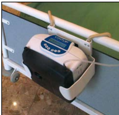
Usage du kit Venturi