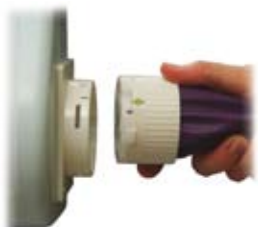
Aansluiting / Connection